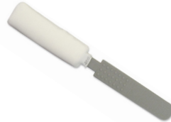
HemoCue Cleaner Plus

For å unngå feilkoder pga. smuss anbefaler vi rutinemessig rengjøring 1 gang i måneden.