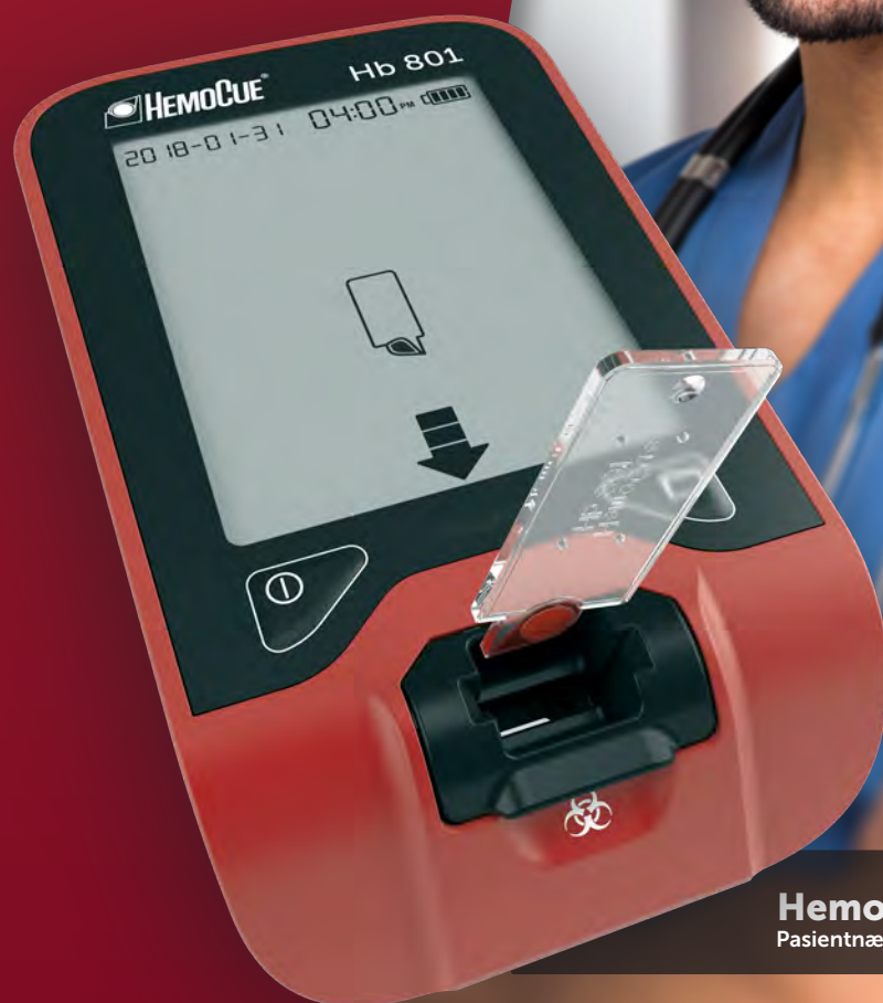
HemoCue Hb 801 Pasientnær hemoglobin-analysering

... fra pionerene innenfor Hb-analysering